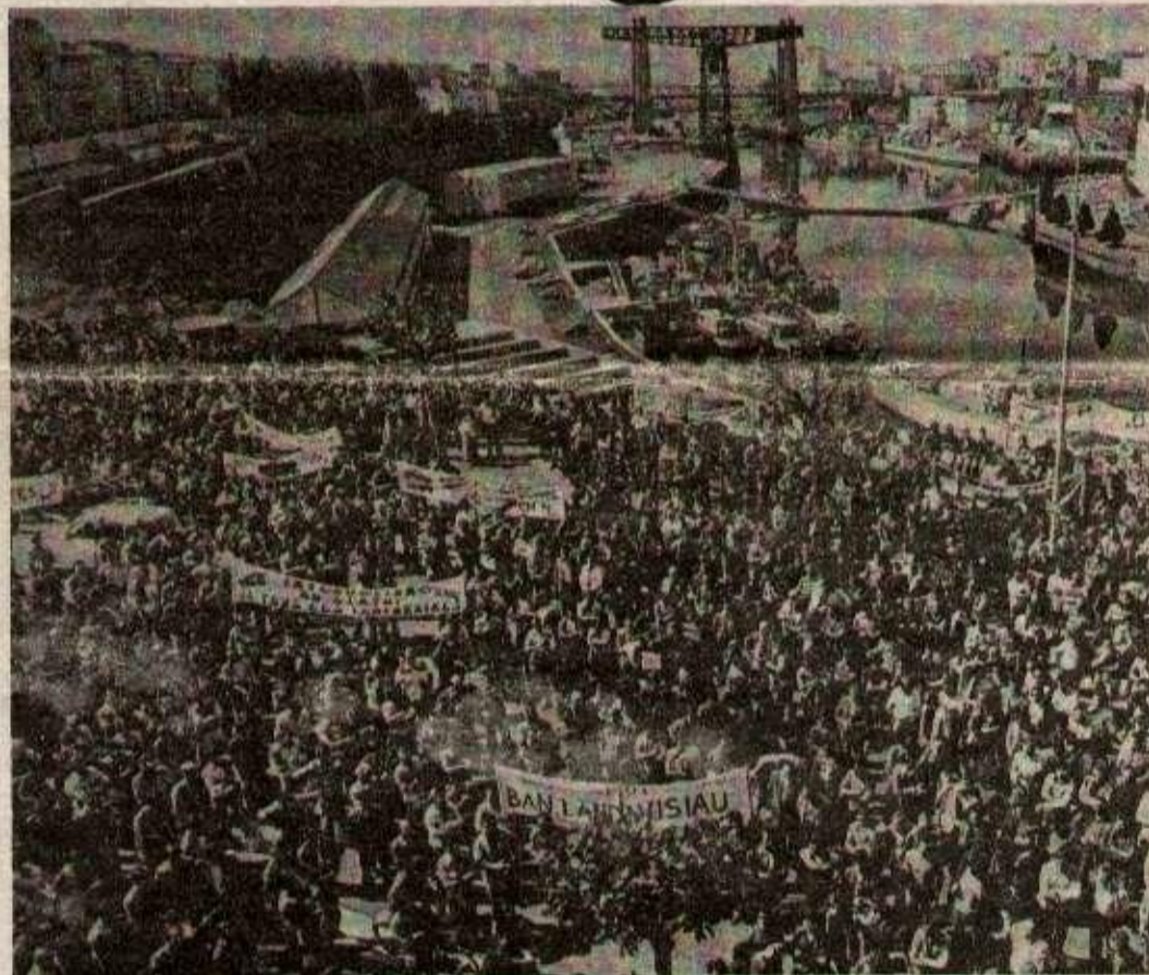
Les travailleurs des arsenaux rassemblés à Brest en 1978.

Les manifestants protestaient à l'appel des syndicats contre les poursuites engagées contre six militants syndicaux de l'arsenal pour « entrave à la liberté du travail »