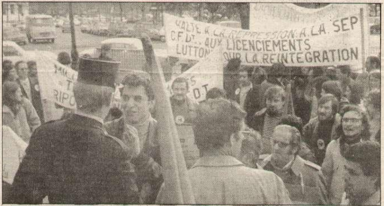
Des «licenciés Durafour» (SEP-Bordeaux, Câbles de Lyon, Bourgogne-Electronique...) manifestaient en 1976 devant le ministère du Travail. Licenciés pour fait de grève... !