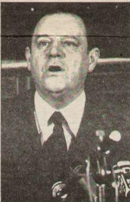
Qui détient les armes de la Constitution ?...