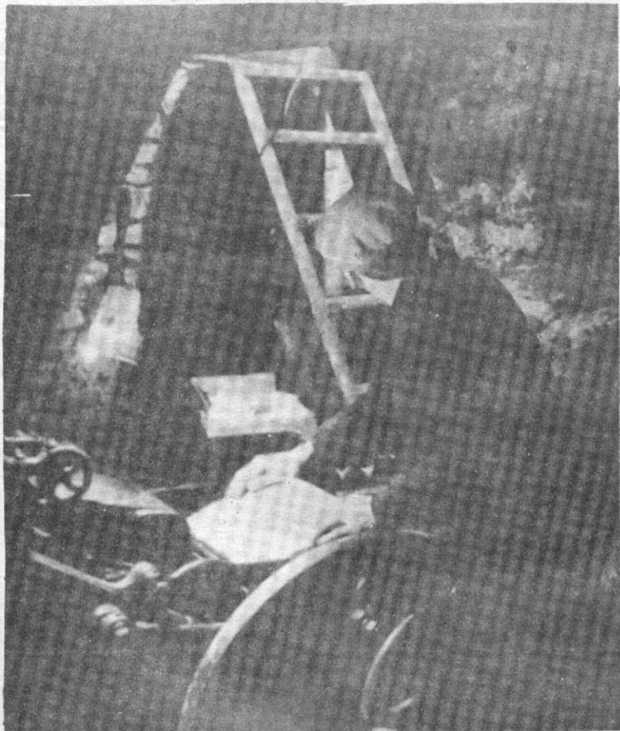
Imprimerie clandestine pendant la Résistance.