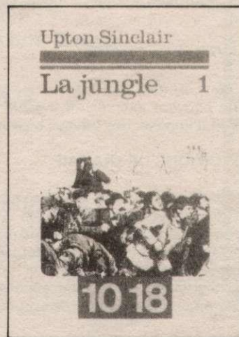
LA JUNGLE (1906 à Chicago) 2 tomes (Ou l'enfer ouvrier de