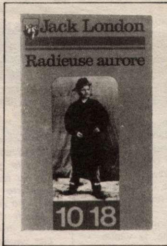
ŒUVRES DE JACK LONDON aux Ed. 10 - 18 de 7 à 17 F

Un livre simple et passionnant qui retrace les débuts du Socialisme en URSS après la révolution d'octobre 1917. Les difficultés du Pouvoir des Soviets à se mettre en place, dans les campagnes, les villages ravagés, pillés par des bandes armées, ou par des Allemands qui envahissaient le pays, jusqu'à l'armée rouge qui les libéra. La vie quotidienne des villageois, vécue par Pavel Kortchaguine. Pavel, qui travaillait à 12 ans 24 heures d'affilée, son évolution, pourquoi il devient Bolchévik, la vie dans le Parti, les trotskistes que faisaient-ils et que voulaient-ils ? Tout cela est très bien décrit car la vie de Pavel n'est autre que celle d'Ostrovski.