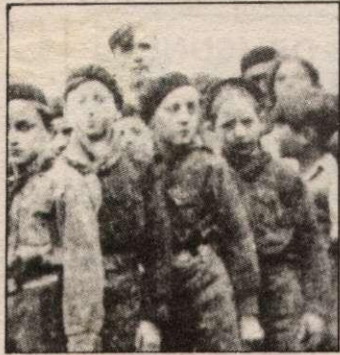
LES BATAILLONS DE LA JEUNESSE De Albert Ouzilias (Ed Sociales) prix 30 F.

La jeunesse de France a joué un rôle de première importance dans la lutte contre l'occupant nazi, dans les années 40.