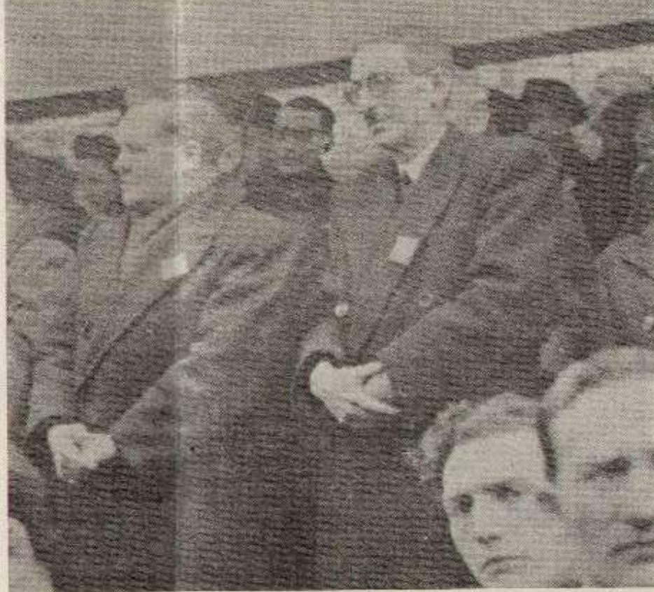
Thorez et Moch, 2 ministres de "gauche" qui ont rendu de fiers services à la bourgeoisie.

contentés de définir cette politique. Ils se sont aussi chargés de la mettre en application.