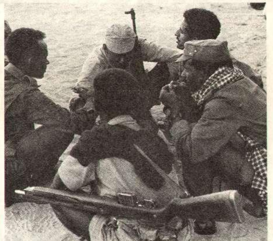
C'est contre ces combattants d'Erythrie que seront utilisés les fusils livrés par Pompidou

Pompidou revient satisfait de son voyage en Afrique. La domination de la France sur Djibouti ne sera pas remise en cause par les 2 grands voisins, la Somalie et l'Ethiopie. En Ethiopie même, l'impérialisme français pourra continuer à développer ses intérêts. Le chemin de fer Addis Abbeba-Djibouti, doublé bientôt d'une route, restera le débouché privilégié des marchandises éthiopiennes ; or Pompidou avait craint un temps que la route entre Addis Abbeba et le port éthiopien d'Assab ne supprime la voie ferrée. La France continuera à entraîner l'armée du Négus et à lui fournir des armes : moyennant de nouvelles facilités financières, le Négus utilisera le prêt de 75 millions de francs, accordé par de Gaulle en 67, pour acheter des armes françaises, notamment des hélicoptères "Alouettes". Ces armes seront fort utiles à l'armée éthiopienne pour réprimer le peuple éthiopien (elle a déjà assassiné plusieurs étudiants) et ces "alouettes" lui serviront contre le Front de Libération de l'Erythrie. L'Erythrie, située