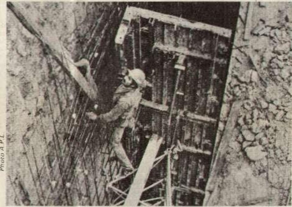
Les conditions de travail dans le bâtiment : plusieurs morts chaque jour !