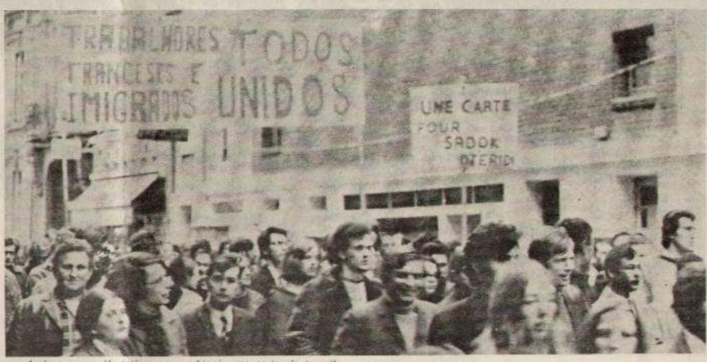
Amiens: manifestation pour obtenir une carte de travail.