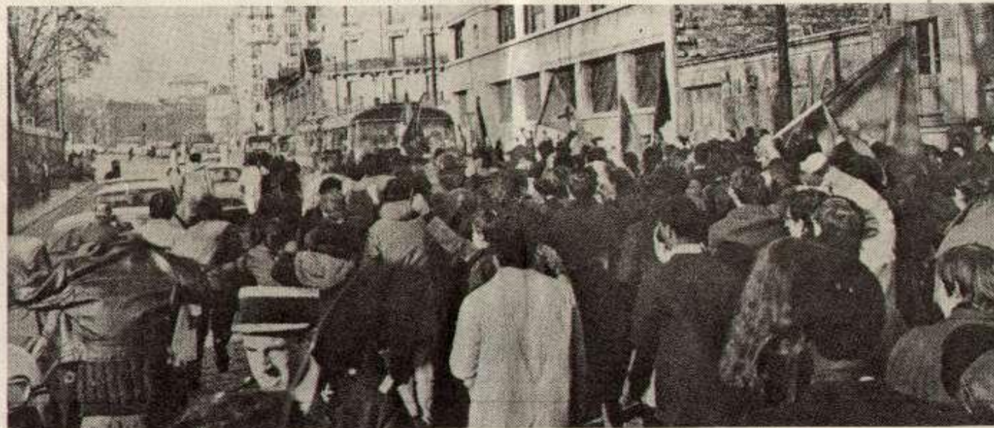
Entierro de 5 trabajadores inmigrados d'Aubervilliers, enero 1972.

las condiciones de vida de los inmigrados, puesto que cualquier extranjero puede recibir un golpe de fusil, como ha pasado con Mohamed Diab bajo pretextos completamente falsos. La xenofobia, el racismo, y las brutalidades fascistas son la ley de todos los comisariados.