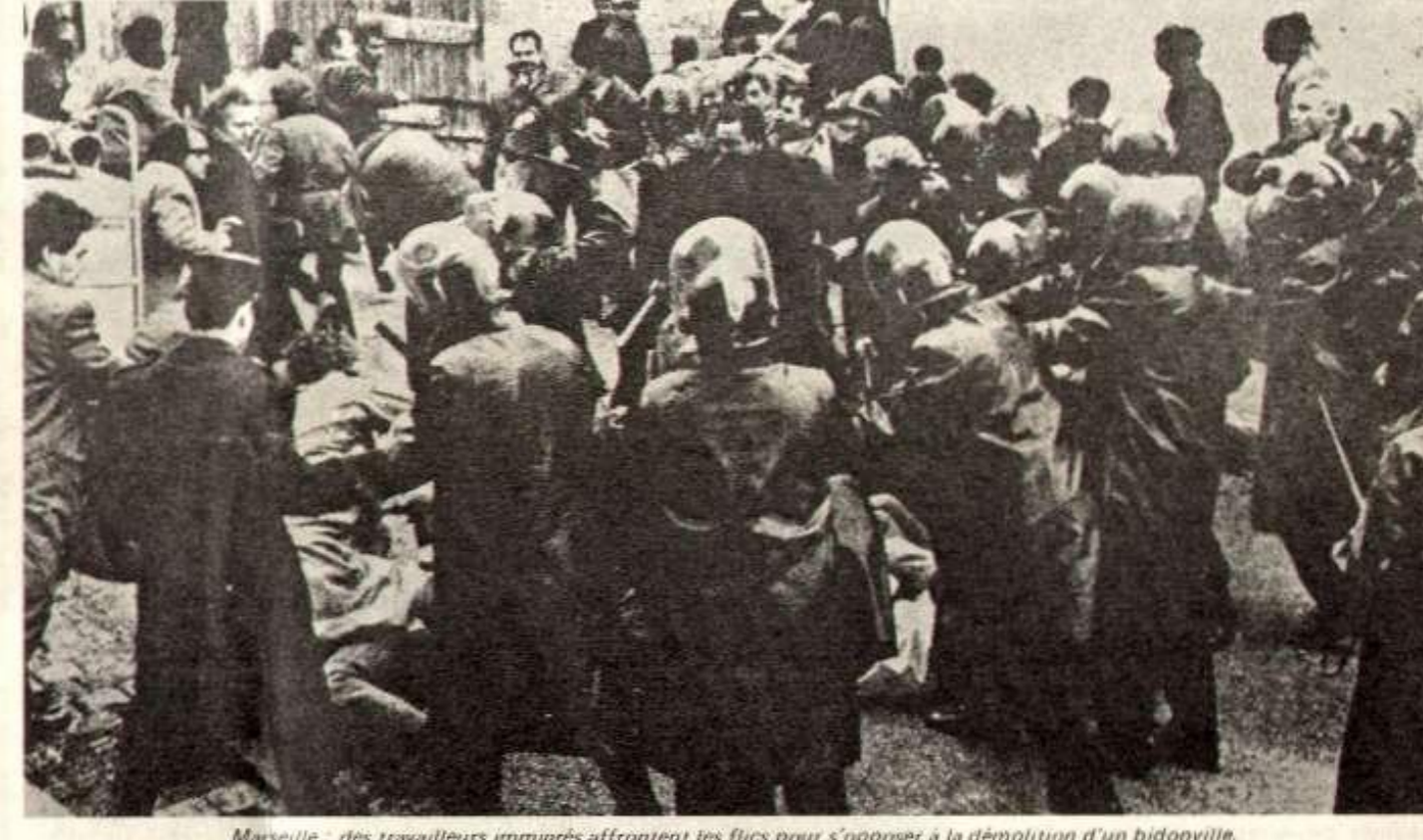
Marseille : des travailleurs immigrés affrontent les flics pour s'opposer à la démolition d'un bidonville.

bureau de main-d'œuvre qui lui délivrait sa carte de travail. Les flics, au vu de la carte de travail, accordaient alors la carte de séjour. A présent, c'est l'appareil policier, instrument le plus direct, avec l'armée, de la dictature de la bourgeoisie, qui décide sans partage du sort des travailleurs étrangers. En renforçant encore la mainmise de sa police sur l'ensemble des travailleurs étrangers, la bourgeoisie cherche à briser leur combativité, à les terroriser, à les détourner de la révolution en France. Cette nouvelle mesure policière s'inscrit dans l'ensemble des mesures visant à renforcer la répression policière de la classe ouvrière : collaboration plus étroite du fichier de la police avec les grosses entreprises pour "enquêtes" avant embauche, loi "anti-casseurs" instituant la responsabilité collective dans les grèves et manifestations et, tout récemment, extension du système de l'ilotage pour quadriller les quartiers ouvriers. Lutter contre la circulaire Fontanet, c'est lutter contre le système d'oppression de la bourgeoisie qui pèse sur l'ensemble de la classe ouvrière.