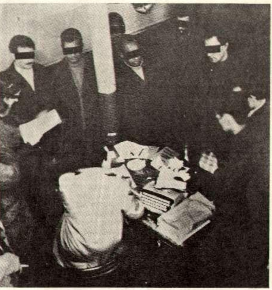
Le propriétaire d'un foyer-taudis sequestre par les ouvriers.