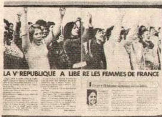
Des manifestantes transformées en supporters du régime... c'est ça la journalisme selon M. Hersant.

En ce sens, Hersant ne présente pas les « garanties financières » que réclament les journalistes du « Figaro » qui redoutent pour leur image de marque d'apparaître comme les valets de l'équipe au pouvoir. C'est pourquoi ils avaient déjà refusé de passer sous la coupe de J.J.S.S.,