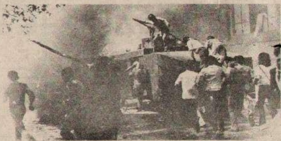
Mendoza, avril 1972 : les travailleurs ont pris un blindé d'assaut.

C'était précisément pour résoudre la crise économique, pour mater la lutte des masses contre l'impérialisme américain et ses représentants en Argentine, que les classes dirigeantes du pays avaient fait revenir Peron au pouvoir. Ils comptaient sur une certaine popularité de ce démagogue pour rétablir le calme, avec l'accord de tout le patronat argentin : l'UIA, représentant les sociétés étrangères et les propriétaires fonciers, la CGE représentant les PME, et l'appareil CGT. L'impérialisme US s'y résigne. Si au départ, il y a pu