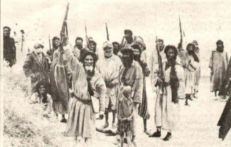
Une guerre de tout le peuple.

Hier, 20 mai, le Front POLISARIO célébrait le 3e anniversaire du déclenchement de la lutte armée de libération du Sahara, à l'époque dirigée contre les colonialistes franquistes espagnols.