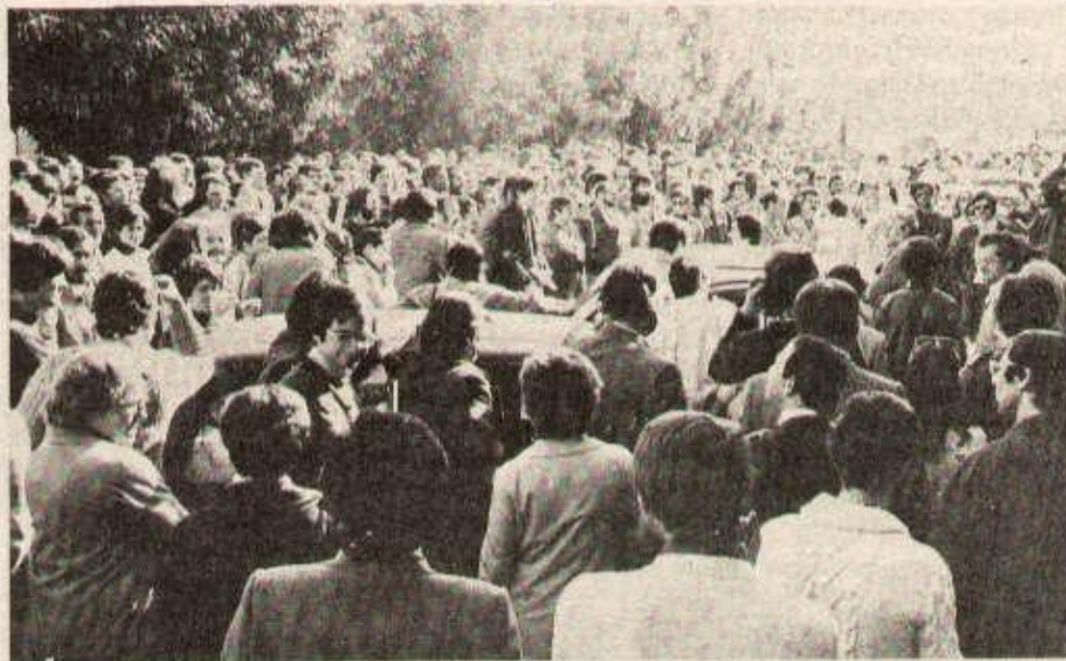
Rassemblement du personnel en grève de la CII à l'intérieur des locaux.

Notre correspondante locale a rencontré le service de presse intersyndical de la CII, qui nous a transmis le communiqué suivant, faisant l'historique de la lutte.