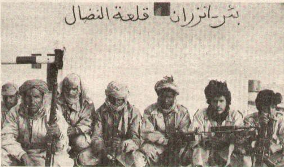
Combattants du Front POLISARIO.

La bataille de «Oun tounsi», «Sank» en témoigne largement, et l'Espagne n'a contrôlé réellement notre pays que vers 1936. Les courants libérateurs sont apparus vers la fin de la deuxième guerre mondiale, notre peuple y a pris part, vers 1957.