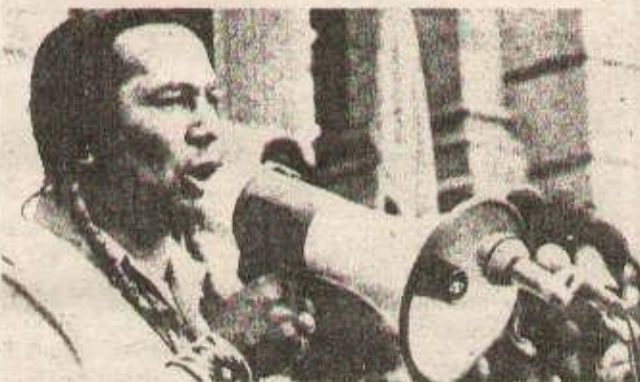
Russel Means, au cours d'une manifestation.