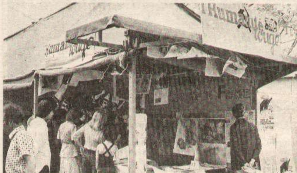
Une vue du stand.

comme une poignée de «révolutionnaires qui rasent les murs le soir et déposent en cachette des tracts dans les boîtes à lettres».