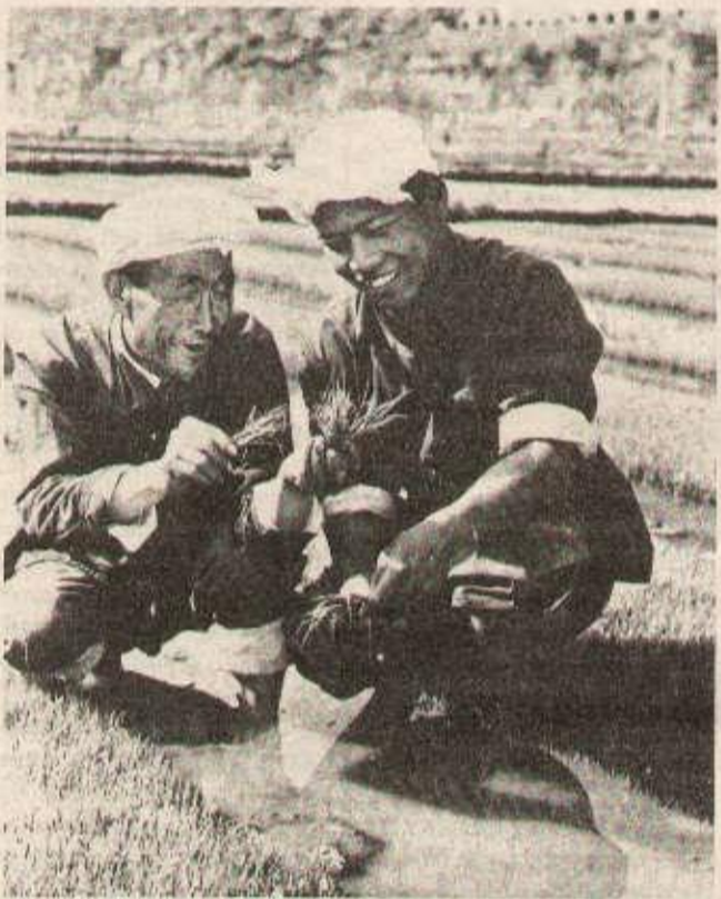
L'enthousiasme de la jeunesse et l'expérience des anciens se conjuguent dans tous les aspects de la lutte, sur le plan politique, comme à la production.

Depuis la Révolution culturelle, la brigade a déjà envoyé plus d'une dizaine de paysans pauvres étudier à l'université ou à l'institut d'agriculture du Hounan.