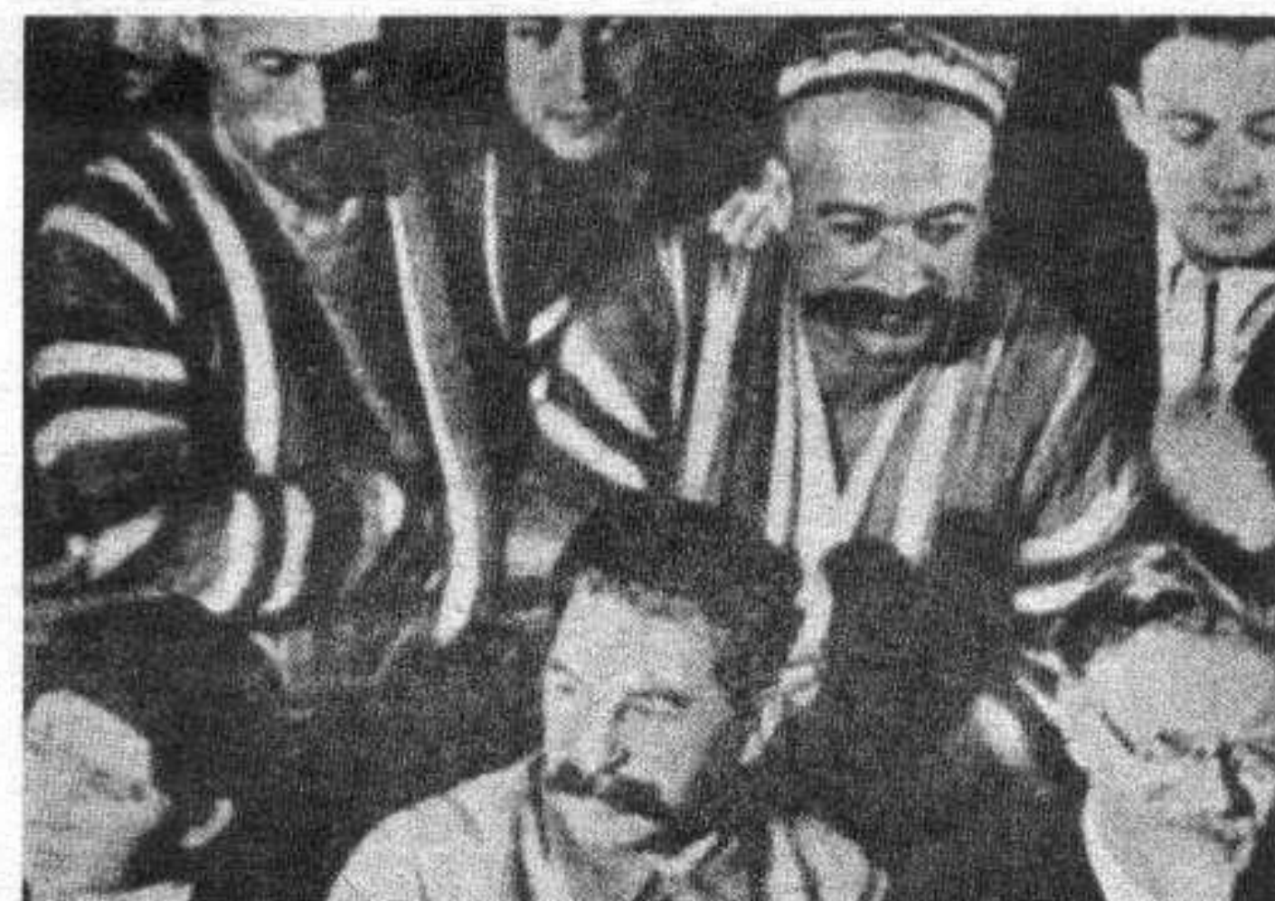
Staline parmi des délégués des populations musulmanes de l'Ouzbékistan au deuxième congrès des kolkhoziens de choc.

Enver Hoxha - discours prononcé à la réunion des 81 partis en 1960 à Moscou, en présence de Krouchtchev.