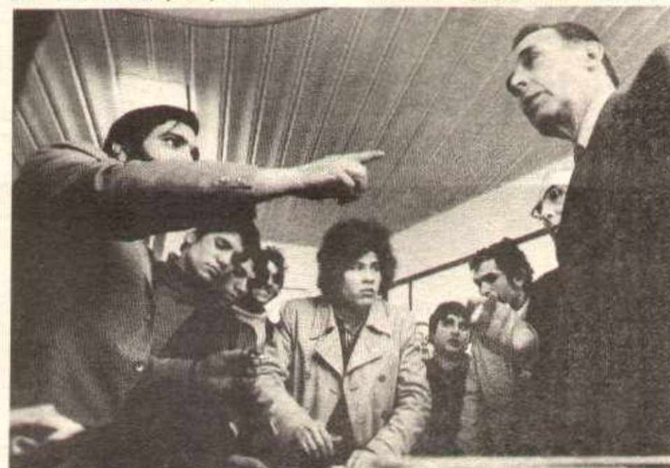
Quatorze travailleurs tunisiens des usines Citroën ont occupé le bureau régional de la Main-d'œuvre (Paris 20 e ) pour obtenir du directeur du Travail la carte de travail.

Travailleurs français, immigrés, tous ensemble exigeons l'abrogation de la circulaire scélérate !