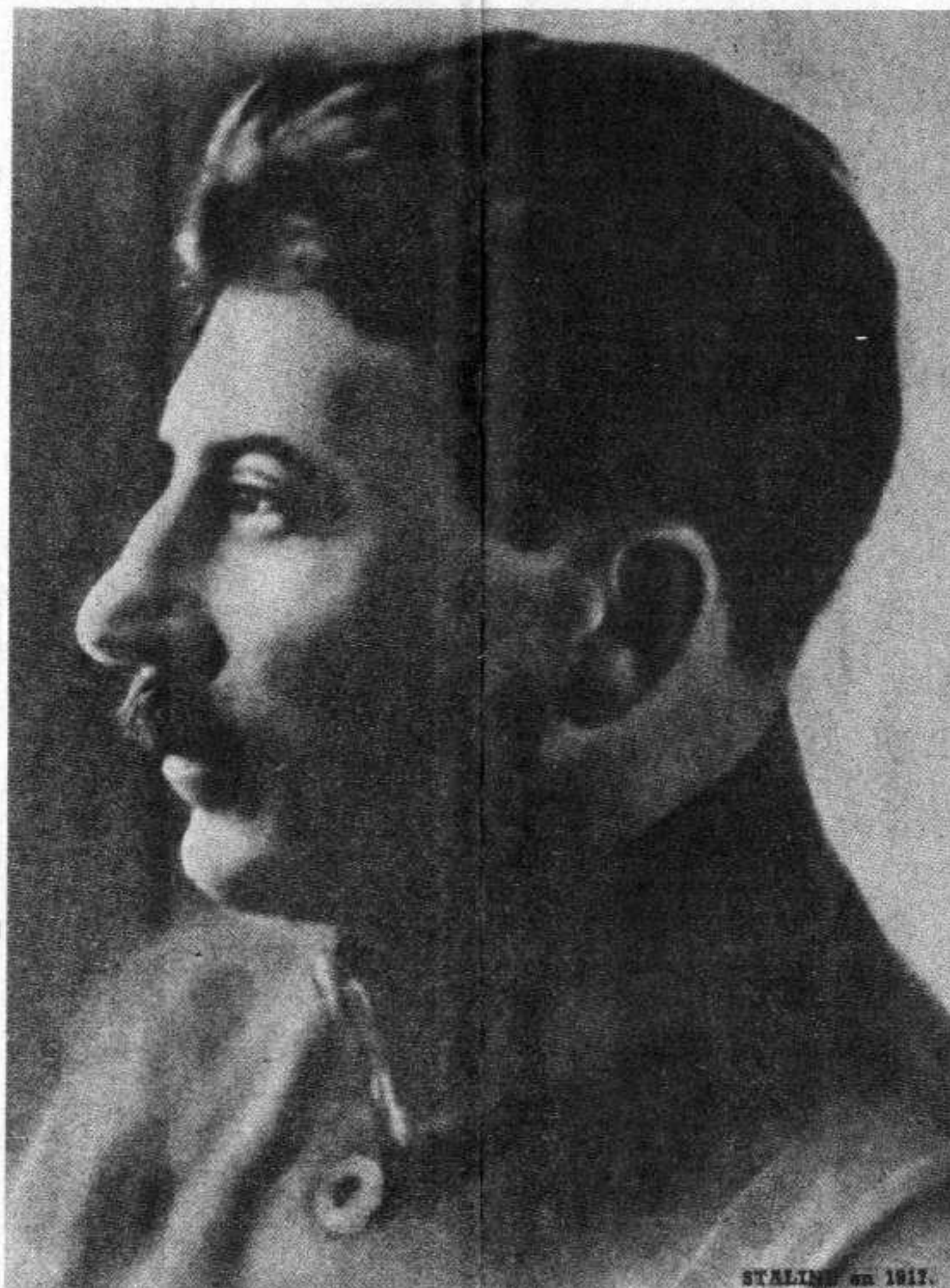
STALINE en 1917.

Maintenant, nous avons perdu notre grand maître et notre plus sincère ami, le camarade Staline. Le malheur que cela représente, aucune parole ne saurait l'exprimer, de même qu'aucune parole ne saurait exprimer le chagrin que nous éprouvons. Notre devoir est de transformer cette douleur en force. En mémoire de notre grand camarade Staline, la grande amitié que son nom symbolise entre le Parti communiste chinois et le peuple chinois et le Parti communiste de l'Union soviétique et le peuple soviétique sera renforcée à l'extrême. Les communistes chinois et le peuple