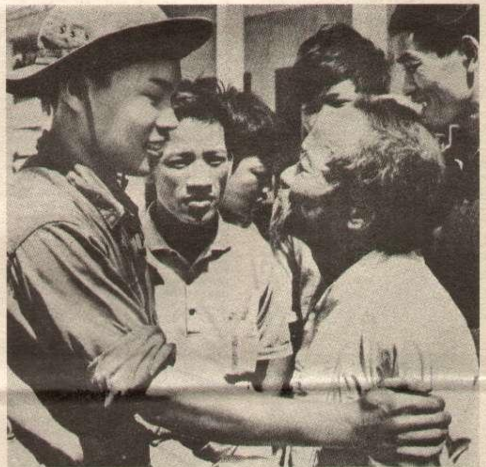
« Nous nous attendons depuis plus de dix années », dit le vieillard au combattant de libération.

Voilà pourquoi cette conférence internationale est un nouveau pas dans la consolidation de la victoire. Le peuple vietnamien et ses représentants authentiques, le G.R.P. et le gouvernement de