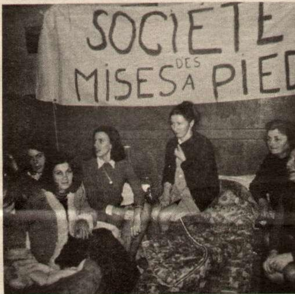
Les ouvrières occupent l'usine jour et nuit.

● Les grévistes sont syndiqués pour la majorité à la C.F.D.T. La grève a été décidée et organisée par la base, avec les délégués C.F.D.T. ;