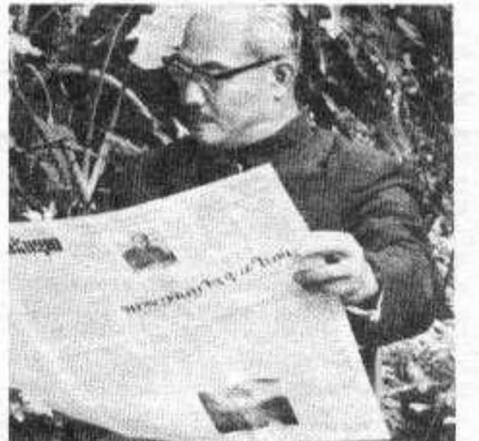
Le prince Souphanouvong, président du Front patriotique lao.

Les Etats-Unis ont déjà des moyens en place ; ils vont essayer de rattacher les finances du Laos à la Banque mondiale en créant des organismes tel que « le Développement du Mékong » (projets de barrages) ou bien un organisme de garantie de la monnaie formé de six pays (U.S.A., Japon, France, Nouvelle-Zélande, Danemark, Grande-Bretagne). Tout cela existe déjà et les Etats-Unis ne sont pas prêts de l'abandonner ; ils vont donner beaucoup de possibilités à la zone de Vientiane pour tenter de