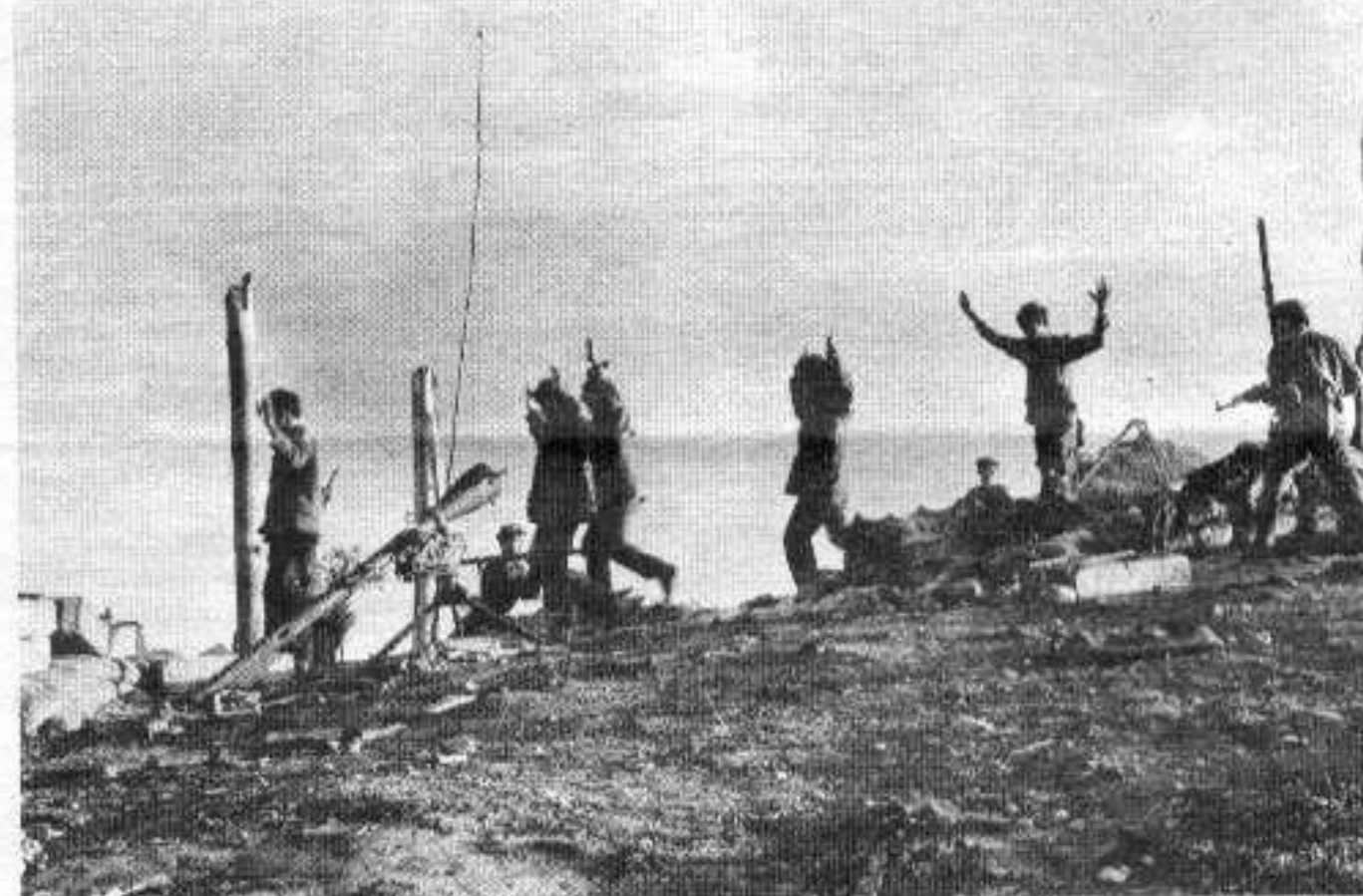
Troupes tautoches thaïlandaises en déroute.

les classes et de tous les partis, de régler leurs propres affaires. Les moyens du règlement sont : un Conseil consultatif politique national pour accélérer l'application des Accords et autres facilités, la neutralisation de Vientiane et de Luang Prabang. En 1962, nous avons lutté pour la neutralisation de l'une ou l'autre ville. Cette fois-ci, nous avons obtenu la neutralisation des deux à la fois et notre zone libérée est bien plus vaste.