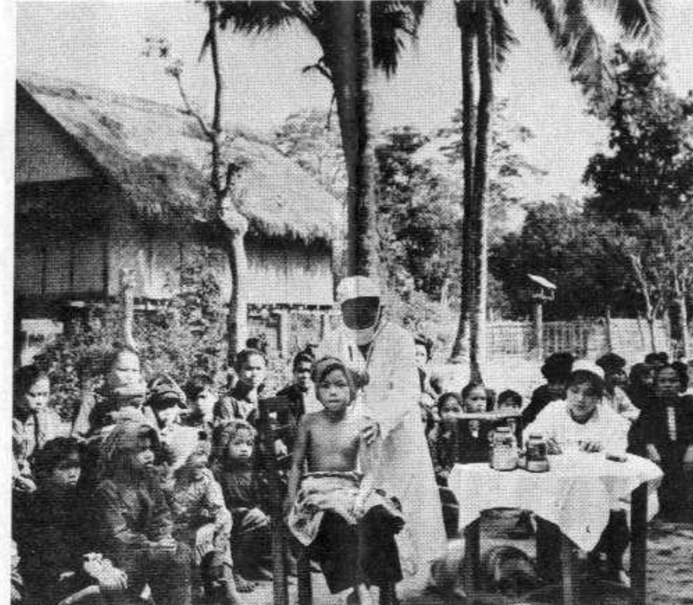
Dans les zones libérées.

La population a vigoureusement condamné ces bombardements. La République populaire de Chine, la R.D.V. et le G.R.U.N.C. les ont également condamnés. Et cela a fait réfléchir la droite. Depuis il n'y a pas eu d'incidents graves mais des menaces de provocations terrestres.