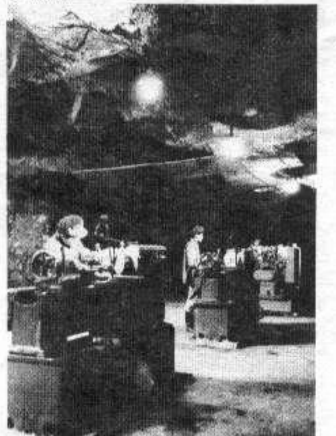
Dans les grottes, usine protégée des bombes américaines.

Cela, nous le qualifions de flux et de reflux. Il y a reflux aujourd'hui car les Américains ont perdu la guerre. Ils en reviennent à utiliser « l'aide » pour préparer une nouvelle intervention armée. Il nous faut arriver à réaliser ce que nous voulons, sinon ce sera à nouveau comme après 1954 et 1962.