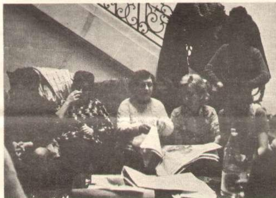
Les ouvrières occupent le siège du groupe Agache-Willot.

Le ministre U.D.R. Bord ayant voulu tenir une réunion électorale à Schirmeck, et ayant été constam-