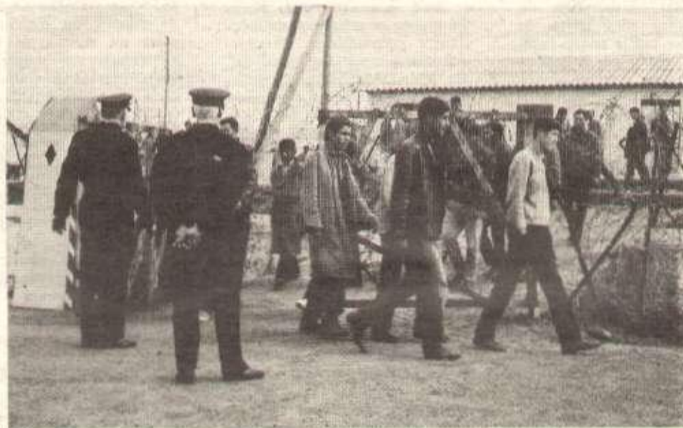
« La Voie » de Slim Riad (sur les conditions d'emprisonnement de 200 000 militants algériens pendant la guerre).

Mais la récupération de l'indépendance nationale assassinée par les Français en 1830 ne constituait pour le peuple algérien qu'une étape sur la route de son émancipation sociale, économique et culturelle. En 1971, le gouvernement du président Boumediène répondant aux aspirations des masses populaires, notamment des fellahs, décidait la mise en place d'une « révolution agraire ».