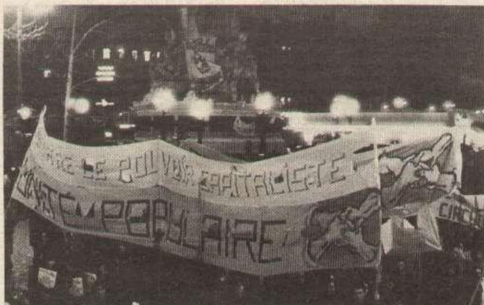
Les militants « Humanité Rouge » brandissent une banderole pour l'unité populaire sur une base de classe prolétarienne.