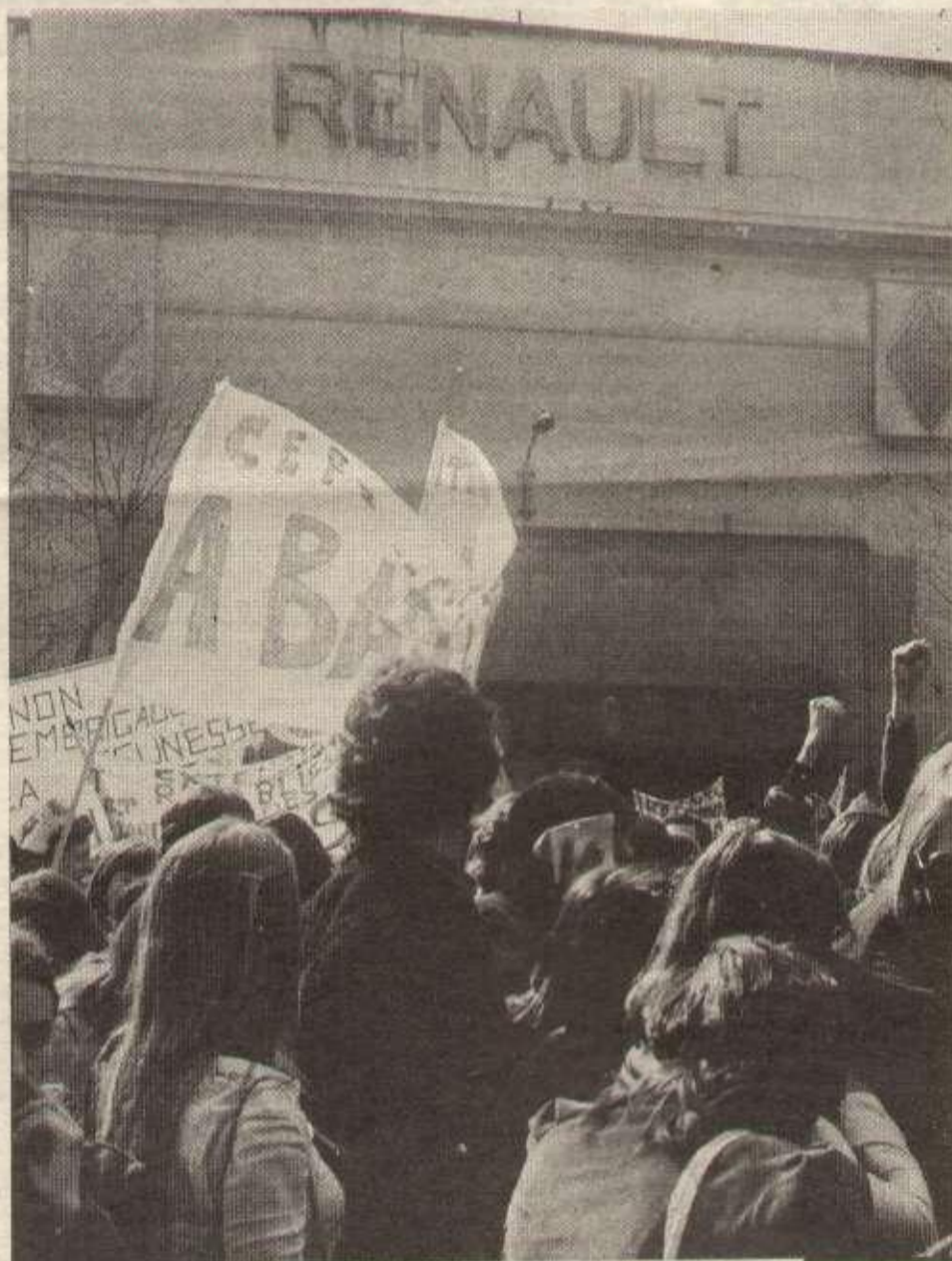
Le 27 mars, 2 000 jeunes des lycées et C.E.T. ont manifesté leur solidarité aux ouvriers en grève.