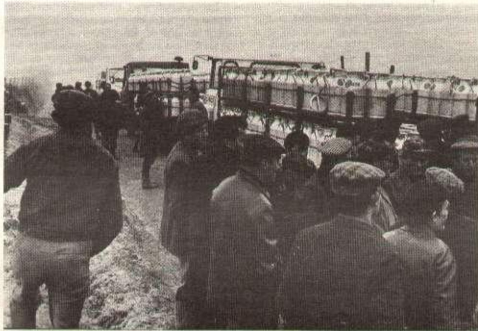
Les agriculteurs bloquent six camions de lait.

Ainsi, à Pré-en-Pail, l'objectif était de bloquer un camion de produits frais pendant un temps indéterminé, tandis que, dans les autres cantons, l'objectif était de bloquer pendant quelques heures des camions de ramassage de leurs propres laiteries. Cette forme d'action, moins dure, a été l'affaire des militants locaux qui l'ont décidée. Chacun a rassemblé ses voisins et ce sont les camions de « leur » laiterie qu'ils ont arrêtés.