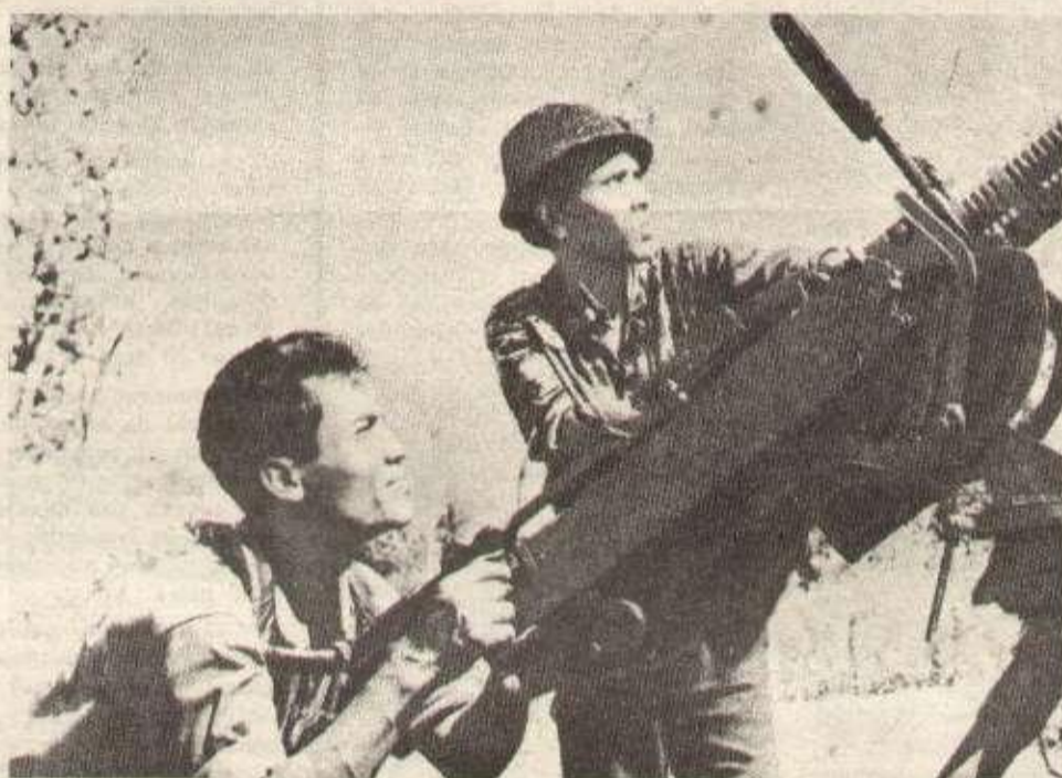
Des zones libérées, bien défendues contre le déchaînement des B 52 de Nixon.

patriotiques ? La route n° 2 (Phnom Penh - frontière vietnamienne) est impraticable, la route n° 5 (Phnom Penh - Battambang) complètement coupée, les autres routes fort menacées sont coupées par intervalles ! La panique règne dans les positions lon-noliennes autour de Phnom Penh, Prey Veng, Kompong Cham, Kampof, Takeo. Personne ne sort des bases fantoches, il s'en faut ! La