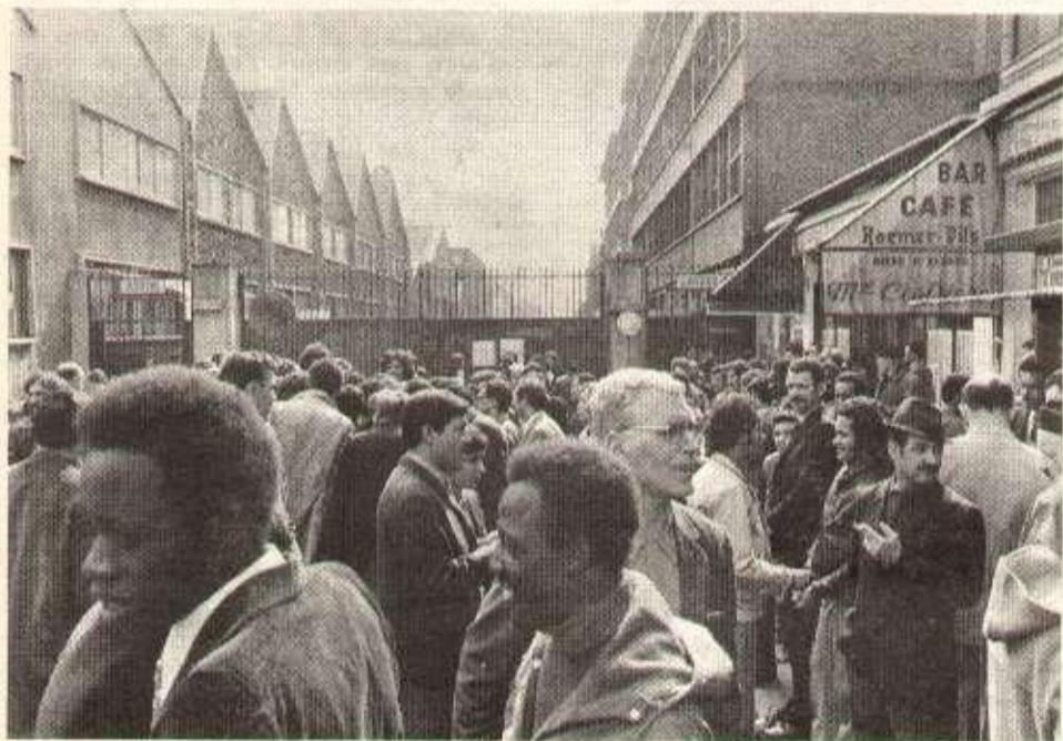
Rassemblement des grévistes devant les portes.

Compter sur ses propres forces et sur la solidarité, intensifier l'Action par la grève avec occupation, voilà de quoi faire triompher la lutte des O.S. des presses, de tous les O.S. de la Régie Renault.