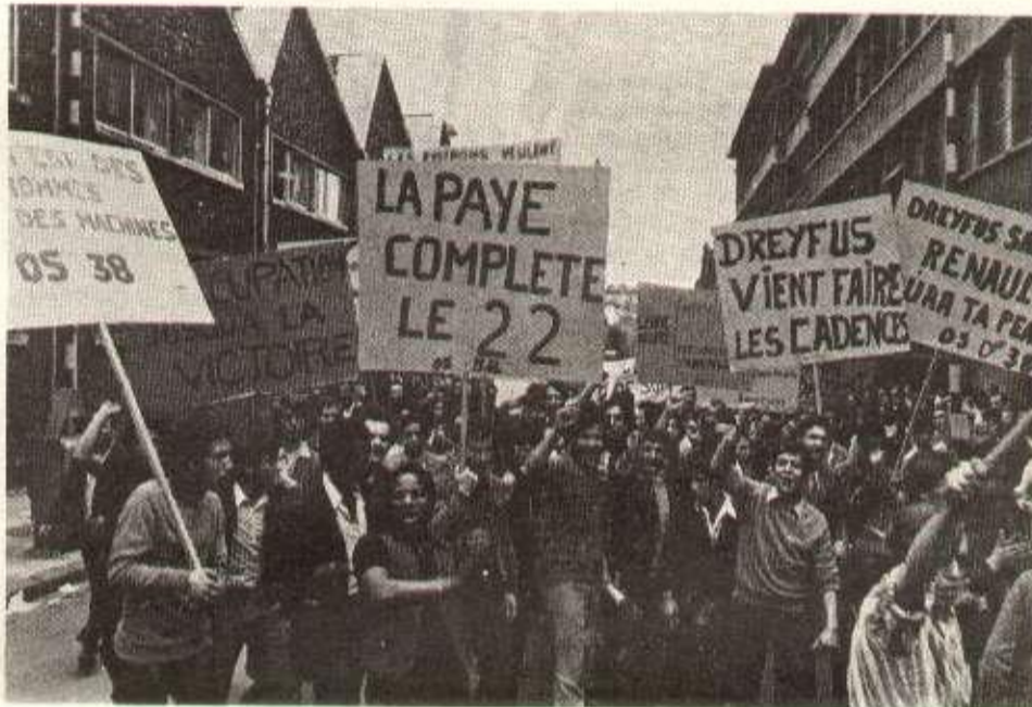
A Billancourt lors d'une précédente grève.