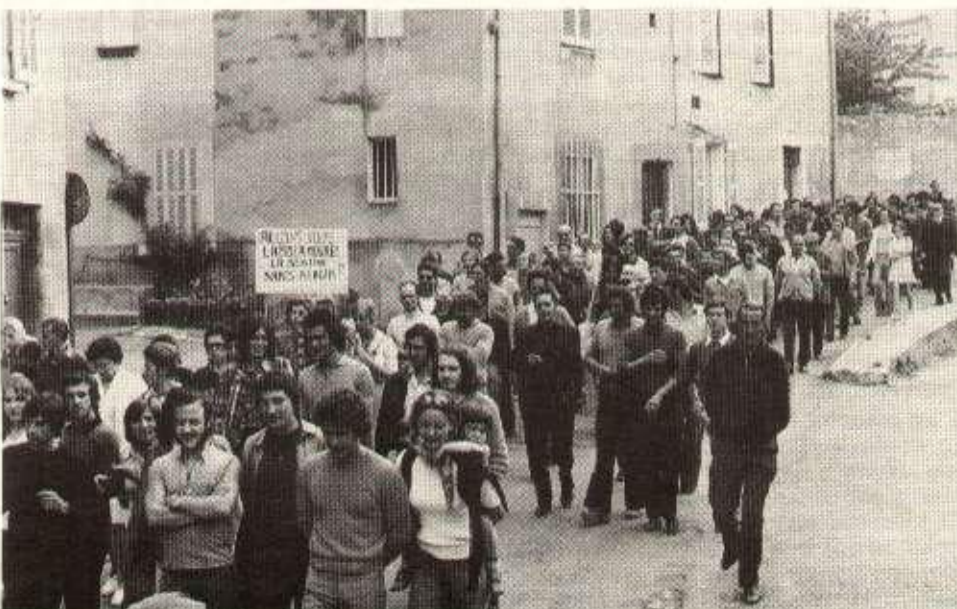
Les mineurs de bauxite manifestent à Brignoles.