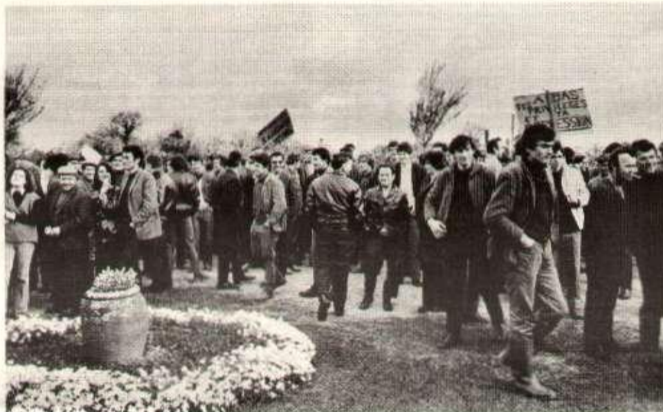
Manifestation de paysans devant la résidence d'un régisseur.