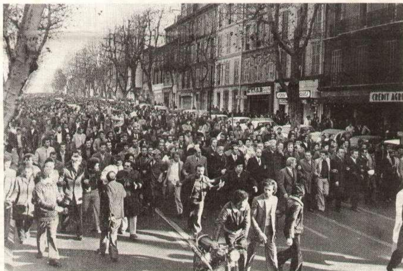
Conduite par l'ambassadeur d'Algérie en France, l'immense foule accompagne les corps jusqu'à l'aéroport de Marseille.

Avoir conscience de ce processus loin d'être un facteur de démobilisation doit renforcer la détermination du prolétariat révolutionnaire : parce qu'en renforçant son appareil d'État, en perpétrant avec rage des crimes racistes la bourgeoisie monopoliste avoue sa faiblesse devant les masses et aussi parce que l'absurdité du « passage pacifique » propagée par les dirigeants