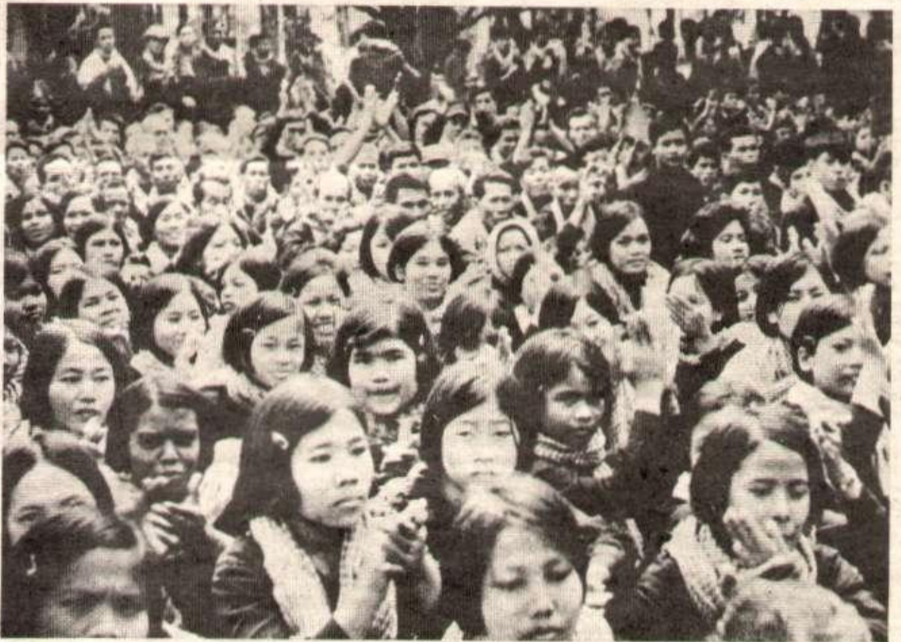
Femmes combattantes des Forces Armées Populaires de Libération Nationale du Kampuchea (FAPLNK) rassemblées lors d'un meeting dans la zone libérée du Cambodge.

(*) « El Moudjahid » du 15 février - éditorial signé Halim Mokdad.