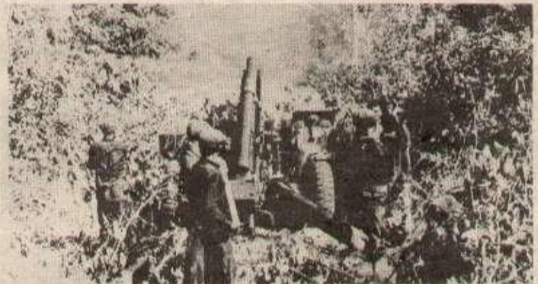
Les FAPLANK à l'attaque contre l'armée fantoche.

La situation des voies aériennes n'est pas meilleure pour les traîtres. Les F.A.P.L.N.K pilonnent avec violence l'aéroport de Pochentong,