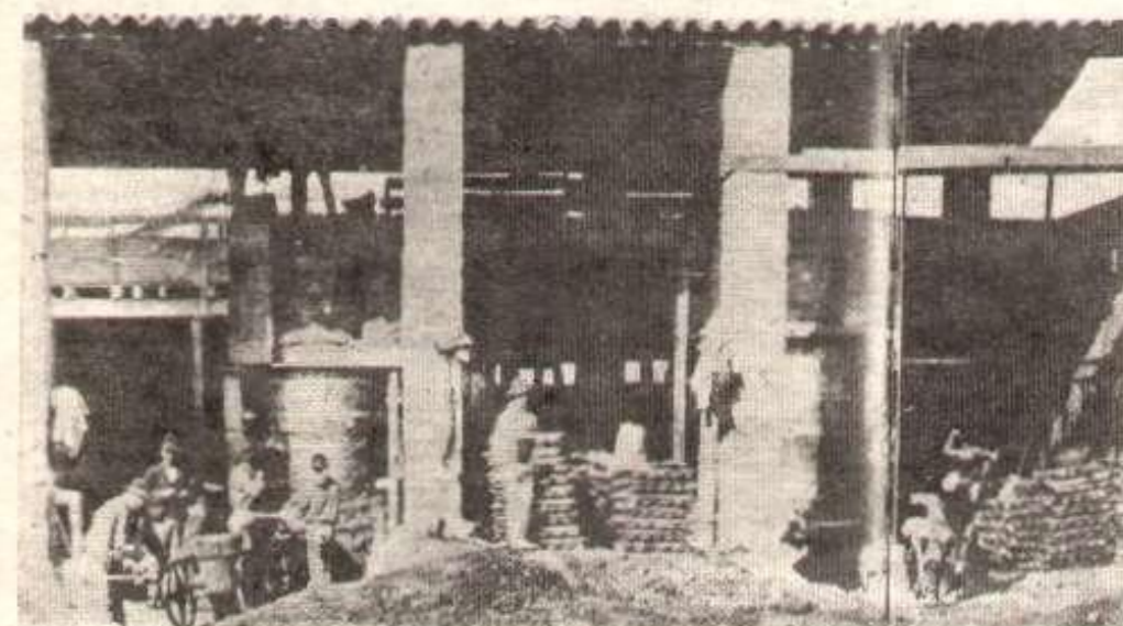
La classe ouvrière subissait une très dure exploitation dans les fabriques.

Le prolétariat parisien avait bien compris le caractère anti-ouvrier de la nouvelle guerre déclenchée par l'Empire. La section de Paris de l'Internationale déclarait le 22 juillet 1870, trois jours après la déclaration de guerre par Napoléon III: « La guerre est-elle juste? Non! La guerre est-elle nationale? Non! Elle est dynastique. Nous adhérons complètement et énergiquement à la protestation de l'Internationale contre la guerre! »