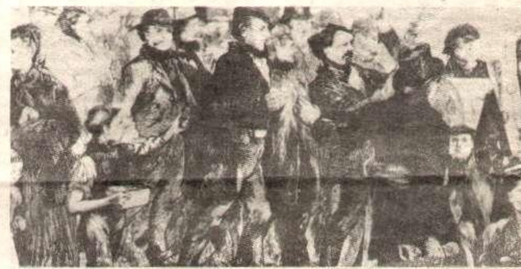
Manifestation en faveur de la Commune à Hyde Park, à Londres, le 16 avril 1871.

La suite nous la connaissons. Le 29 août, les forces agressives du fanfaron Bonaparte après de petites défaites, s'écrasèrent à Sedan devant les armées de Bismark. Comme l'avait également analysé K. Marx, dans sa première adresse. La vitalité de l'Empire n'était qu'apparence.