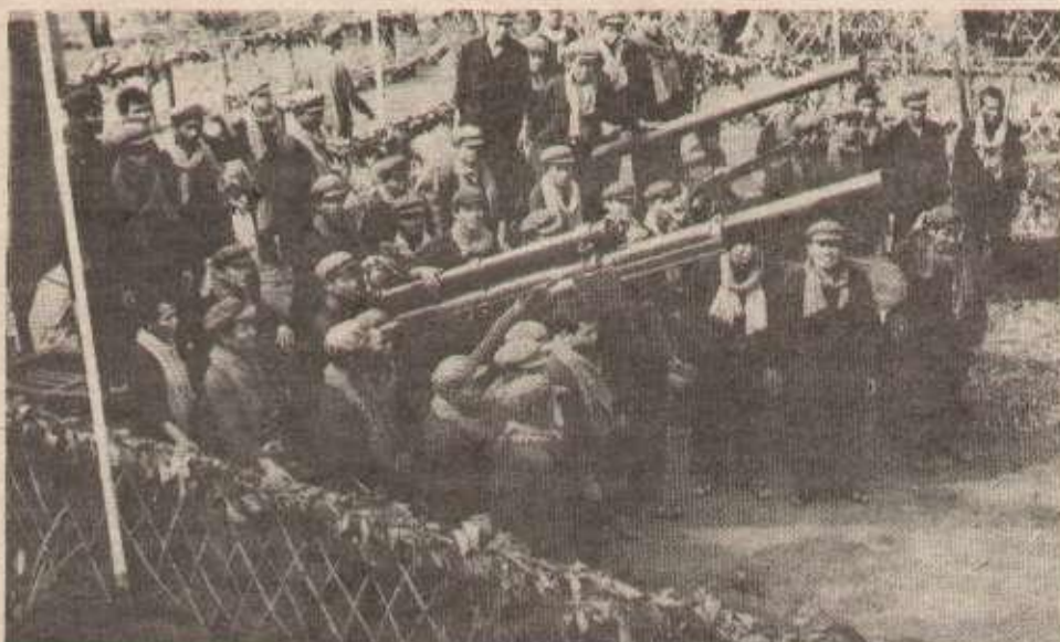
Kieu Samphan, chef d'état-major des F.A.P.L.N.K., parmi les combattants.

« l'américanisation de la guerre aérienne », ni les milliards de dollars, la puissance matérielle et technologique des impérialistes américains et leurs plus de 4 000 conseillers militaires au service de la « khmériisation de la guerre », ni leurs manœuvres politiques et diplomatiques les plus perfides, n'ont pu ébranler la détermination et l'élan victorieux du peuple du Kampuchéa et de ses F.A.P.L.N.K. Bien au contraire, trempés dans le creuset de la guerre de libération nationale, le peuple du Kampuchéa, ses F.A.P.L.N.K., son F.U.N.K. et son G.R.U.N.K. ont, au cours de ces 5 années de lutte âpre et pleine de sacrifices, fait preuve de forces irrésistibles et de leur capacité totale à maltraiter les lois de la guerre populaire, ils sont plus unis et plus déterminés que jamais.