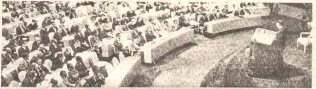
Le président Boumediène à la tribune des Nations Unies.

L'Europe est le cœur même de la rivalité entre les deux superpuissances. Lorsqu'elles se combattent pour contrôler des pays du tiers-monde c'est, d'une part, pour faire main basse sur les richesses de ces pays, mais c'est aussi et surtout pour renforcer leur position en Europe. Les deux