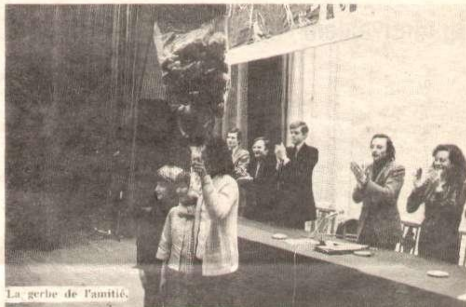
La gerbe de l'amitié.

Le peuple cambodgien le sait : l'impérialisme ne disparaîtra pas avec la défaite du géant américain. C'est pourquoi, dans la reconstruction économique du pays ravagé par la guerre impérialiste, il entend, là aussi, compter d'abord sur ses propres forces et n'acceptera jamais une « aide » qui prétendrait lui lier les mains. Déjà indépendant et souverain dans sa guerre de libération nationale, le peuple cambodgien entend l'être, à