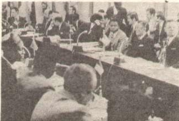
Conférence de l'O.P.E.P.

ment ont insisté pour que le terme de « pays associé » ne figure pas dans la convention de Lomé, en raison de la notion de subordination qu'il évoque. Ils ont, au cours de leurs négociations, clairement affirmé que la convention devait se borner à traiter des affaires commerciales et économiques et qu'elle n'avait pas à porter préjudice à leur indépendance politique ou à leurs relations avec d'autres pays du tiers monde. Succès donc importants pour les 46 pays concernés, dans leur lutte contre le vieux ordre économique international.