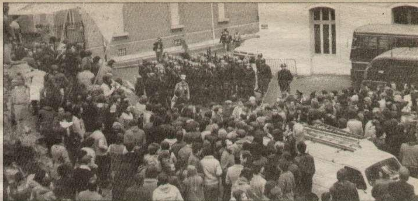
Un face à face entre les flics et les grévistes d'Alsthom à Belfort en fin de semaine dernière.