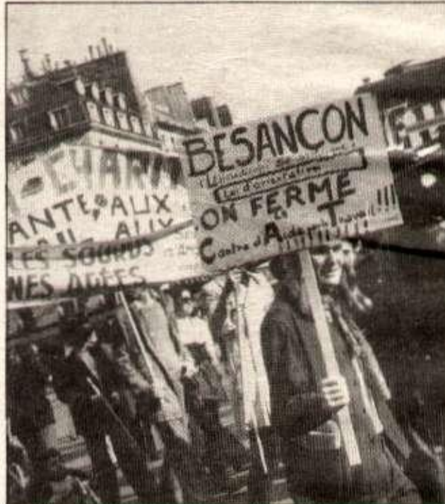
Une manifestation des travailleurs du C.A.T. ; une longue tradition de lutte.

La vérité doit être dite sur le bradage du C.A.T. de Besançon, les coupables dénoncés, démasqués. Toutes les manigances tant politiques qu'éco-