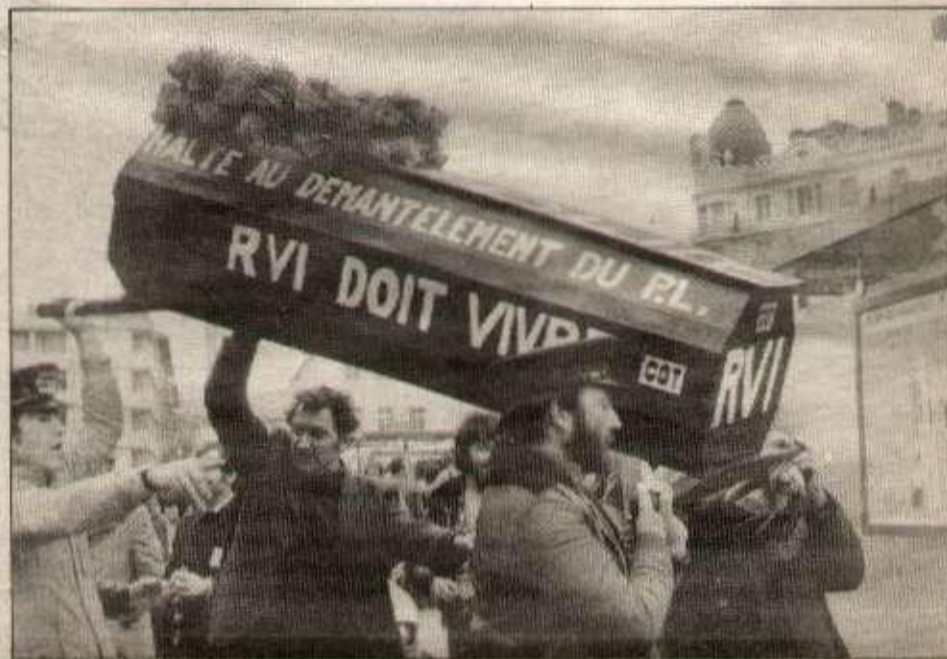
Faudrait-il enterrer la lutte pour que vive RVI ?

On s'en doute, la voie engagée depuis quelques semaines à Vénissieux n'est pas la voie de la lutte. Et ce sont bien les travailleurs qui en font les frais, leurs salaires, leurs emplois futurs, comme les organisations de classe qu'ils se sont donnés.